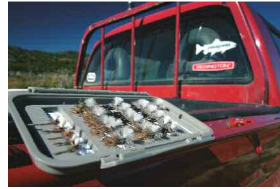
Una selección de tricos para la pesca en superficie. Debajo, una captura con chernobil. Derecha, pescando un arroyo en la estepa o pampa patagónica.