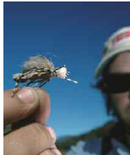
La Fat Albert es una de las moscas más efectivas. En las otras imágenes, pescando distintos escenarios.